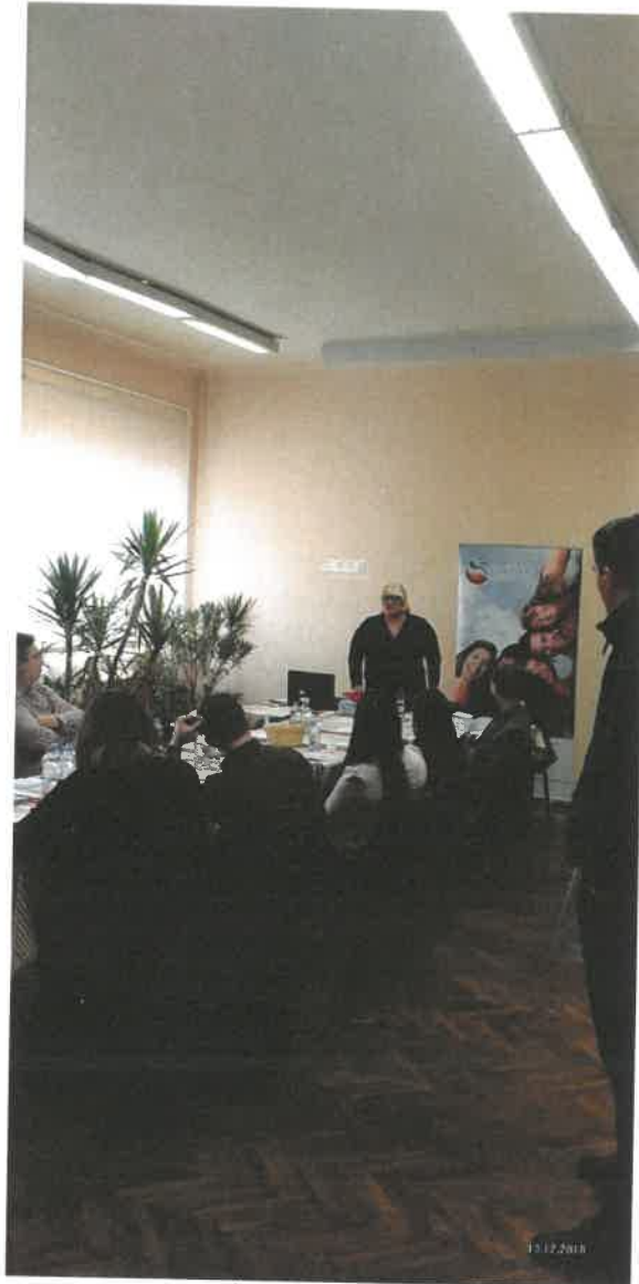
LEADER HIÁNPÓTLÁSOK – FÓRUM 2018.12.13. 14 óra Nyíradony