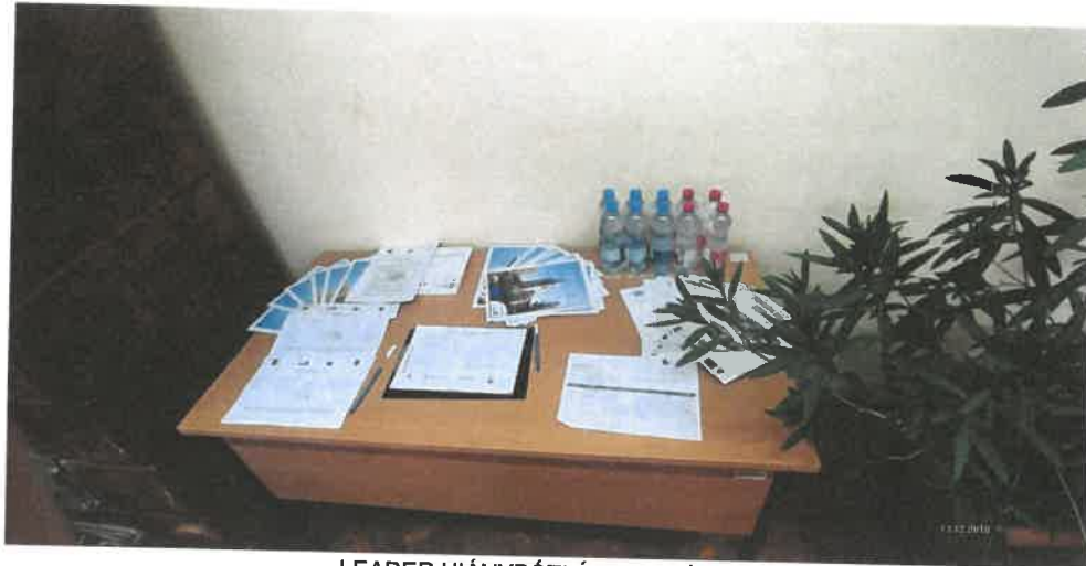
LEADER HIÁNPÓTLÁSOK – FÓRUM 2018.12.13. 14 óra Nyíradony