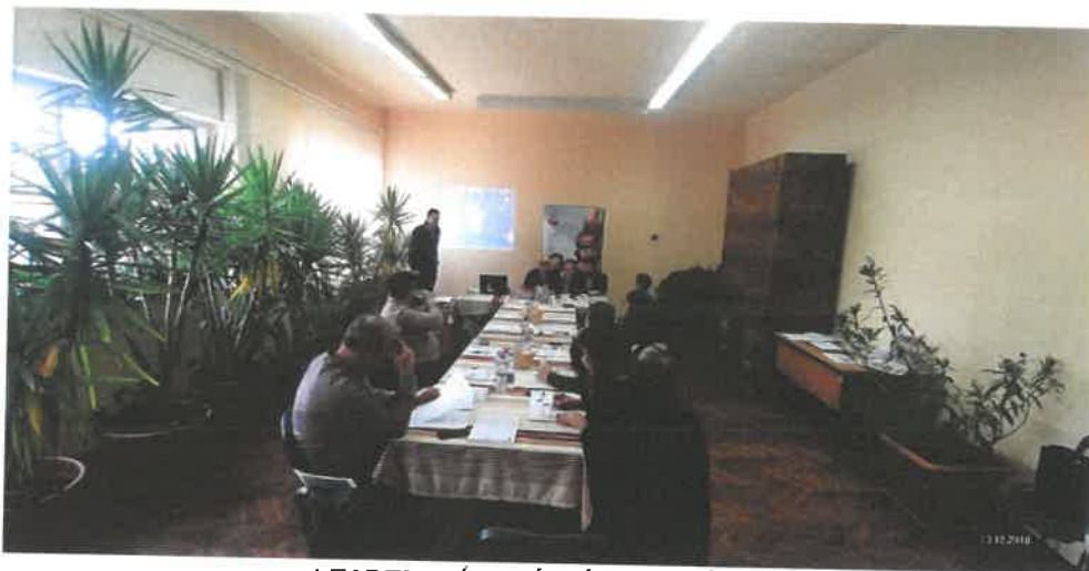
LEADER HIÁNPÓTLÁSOK – FÓRUM