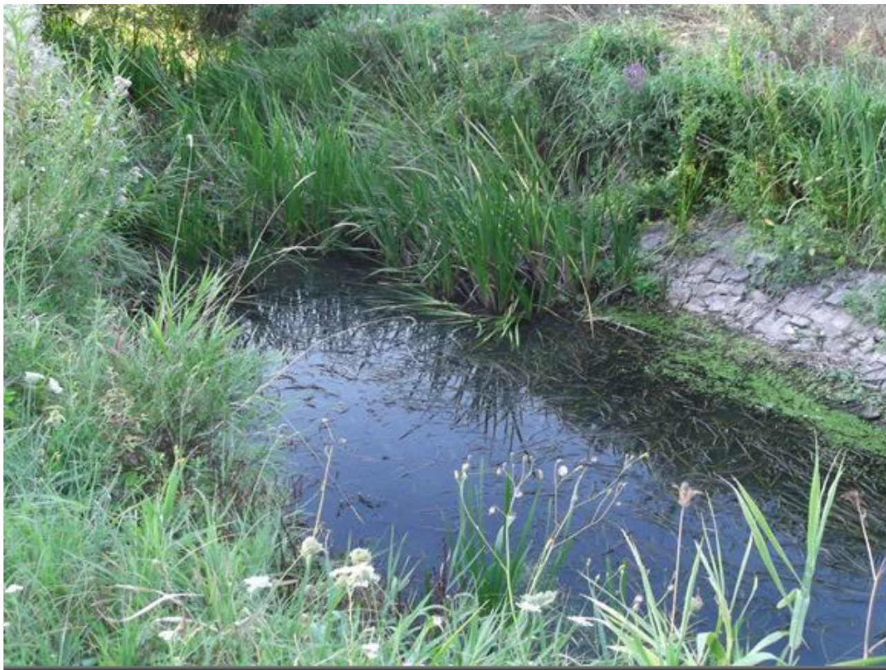
Gúti - ér