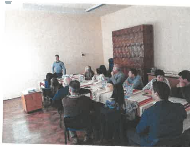
LEADER Pályázatok Fórum 2018.09.24. 16 óra Nyíradony