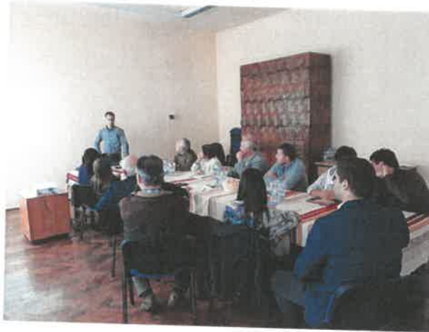
LEADER Pályázatok Fórum 2018.09.24. 16 óra Nyíradony