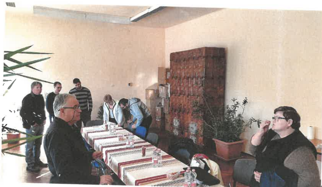
LEADER Fórum 2020.02.06.