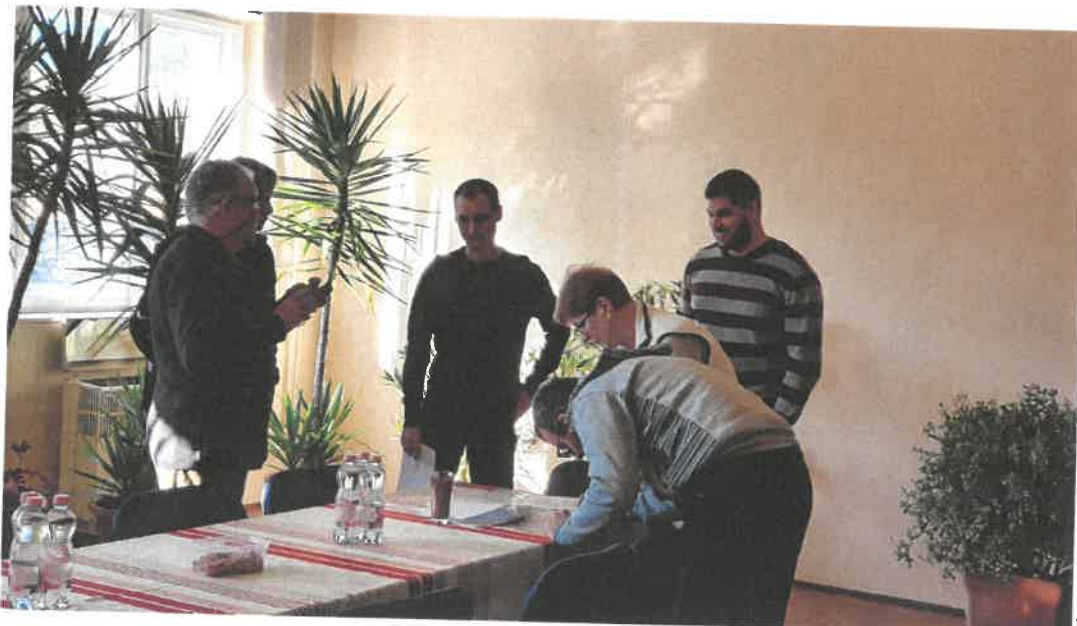
LEADER Fórum 2020.02.06.