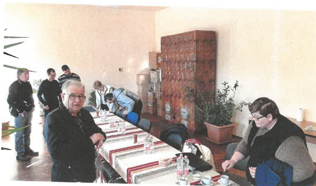
LEADER Fórum 2020.02.06.